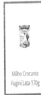
Milho Crocante Fugini Lata 170g