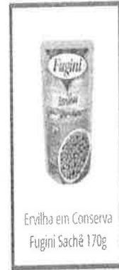
Ervilha em Conserva Fugini Sachê 170g